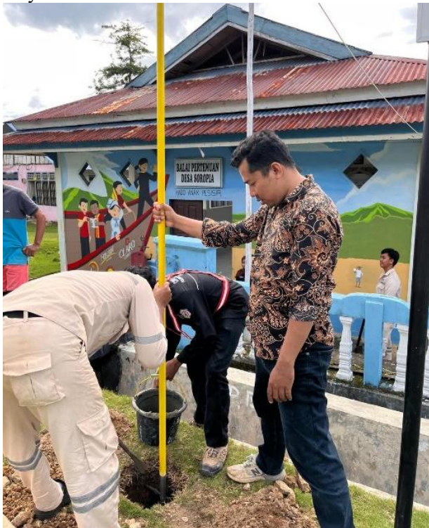
Gambar 4. Pengecoran dasar dan pondasi tiang penerangan

untuk membentuk pondasi permanen yang stabil. Aktivitas ini melambangkan penjangkaran permanen dari kedua infrastruktur dan kemampuan baru masyarakat di dalam desa.