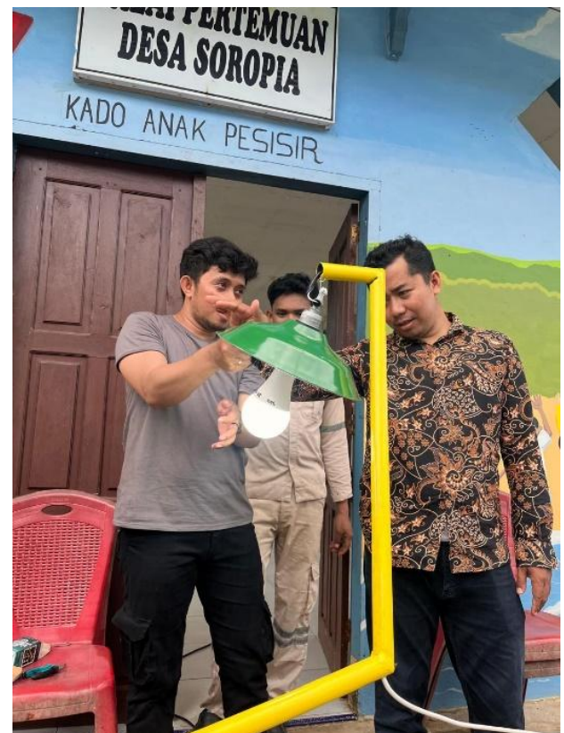
Gambar 3. Instalasi Listrik pada tiang penerangan (Keterangan: Peserta melakukan pemasangan kabel listrik dan komponen pada tiang, menekankan integrasi fitur keselamatan seperti grounding dan proteksi sirkuit yang terhubung ke jaringan.)

Dengan tiang yang terakit, fokus beralih ke sistem kelistrikan. Gambar 3 mendokumentasikan fase penting dari instalasi listrik, di mana peserta, di bawah bimbingan, menghubungkan kabel ke jaringan, memastikan grounding dan proteksi arus lebih yang tepat telah terpasang. Pengalaman langsung ini sangat penting untuk mendemistifikasi sistem kelistrikan dan membangun kepercayaan diri dalam menangani komponen-komponennya dengan aman.