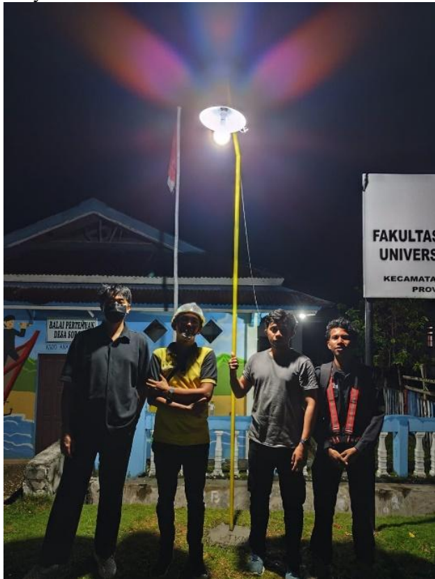
Gambar 6. Konfirmasi penerangan saat malam hari (Keterangan: Konfirmasi fungsional lampu jalan hasil buatan masyarakat yang terpasang dan beroperasi di malam hari, menunjukkan keberhasilan proyek dalam menyediakan penerangan umum yang aman dan andal.)

usaha: sebuah foto lampu jalan terpasang yang beroperasi di malam hari, berhasil menerangi area yang sebelumnya gelap dan berpotensi berbahaya di Desa Soropia. Gambar ini bukan hanya bukti keberhasilan teknis; ini adalah bukti ruang publik yang baru diamankan, keselamatan yang ditingkatkan, dan potensi terealisasi dari pembangunan yang dipimpin masyarakat.