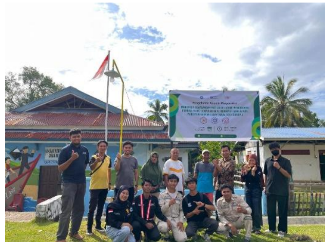
Gambar 5. Dokumentasi Akhir bersama setelah workshop dan pemasangan

masyarakat dari berbagai usia dan latar belakang mengelas, merangkai kelistrikan, merakit dan menyelesaikannya bersama sebagai bentuk latihan membangun kerjasama tim yang kuat dan solid .