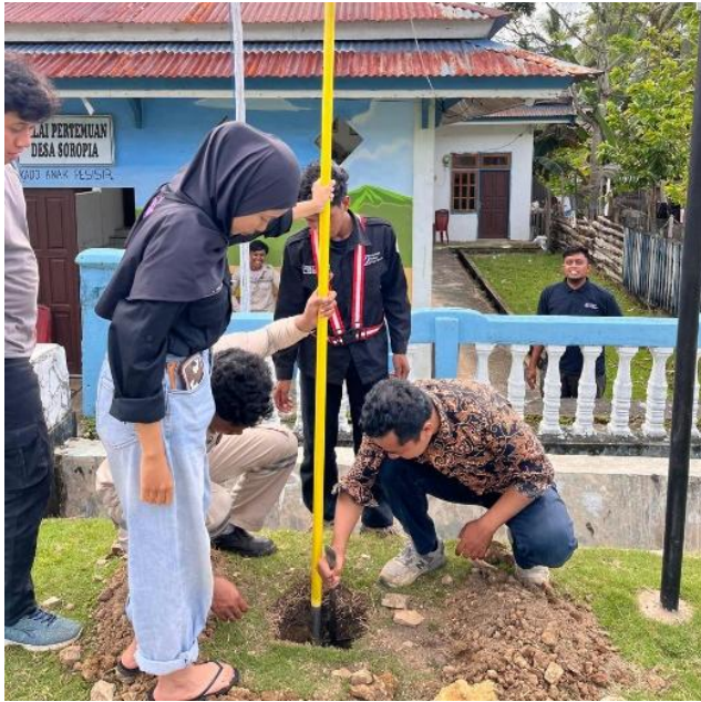
Gambar 1. Persiapan pondasi dan pengecekan lubang galian sebagai dasar tiang Penerangan (Keterangan: Anggota masyarakat mempersiapkan dan memverifikasi lubang pondasi yang digali, memastikan kepatuhan terhadap spesifikasi teknis yang dirancang bersama.)

Pelaksanaan praktis proyek dimulai dengan persiapan lokasi. Gambar 1 menunjukkan peserta selama fase persiapan pondasi, memeriksa dimensi dan kedalaman lubang galian untuk memastikannya memenuhi spesifikasi 40cm x 40cm x 60cm, sebuah aplikasi langsung dari prinsip-prinsip struktural yang dipelajari selama fase desain.