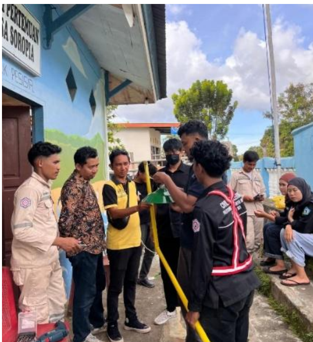
Gambar 2. Perakitan seluruh komponen tiang penerangan setelah proses fabrikasi

(Keterangan: Perakitan semua komponen tiang lampu setelah proses fabrikasi yang dipimpin masyarakat, menampilkan output nyata dari pelatihan pengerjaan logam mereka.)